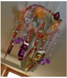
„Berg-Sommergeflüster“ 10.-12.August 2011 Workshop in Tartar